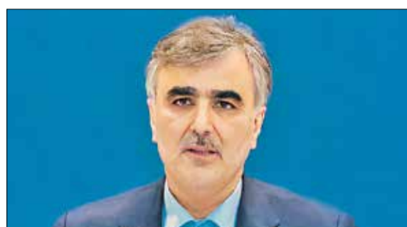
رئیس کل بانک مرکزی: