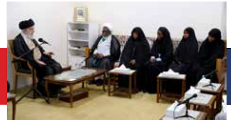
رهبر انقلاب در دیدار رهبر جنبش اسلامی نیجریه: