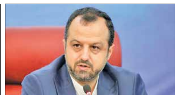
وزیر اقتصاد اعلام کرد

مخالفت منظور با احکام تکلیفی به بانک‌ها در برنامه هفتم