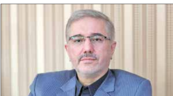
بررسی جزئیات لایحه برنامه هفتم توسعه: