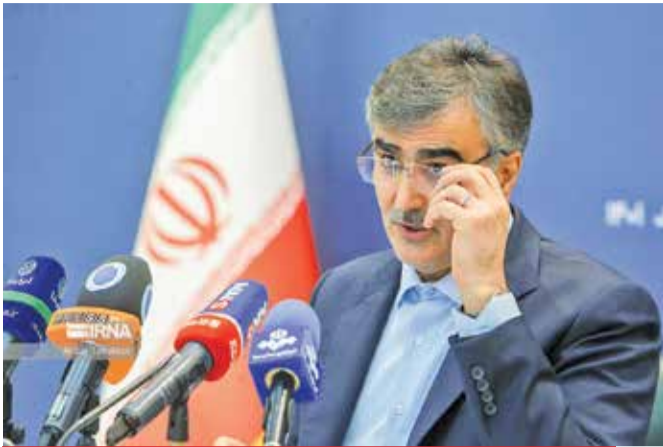
محمدرضا فرزین رئیس کل بانک مرکزی: تورم نقطه به نقطه تاکنون نزدیک به ۱۴ واحد درصد کاهش یافته است

براتی گفت: دلایل متعددی را می‌توان برشمرد که چرا امریکا حاضر شده است با ایران به توافقی محدود دست یابد که از جمله آن می‌توان به شرایط داخلی آن کشور و انتخابات پیش روی آن اشاره کرد. وی با بیان اینکه «دولت بایدن دستاوردی در خصوص پرونده ایران نداشته» و از این منظر تحت فشار قرار دارد، افزود: این موضوع بیانگر شکست‌های دولت امریکا در قبال ایران است. همان‌طور که در مقاله اخیر مجله فارن افزر هم به آن اشاره شده است موقعیت ایران نسبت به گذشته متفاوت شده است و «توانسته بر بخش مهمی از خطرات ناشی از تحریم فائق آید» و دیگر تحریم برای ایران تهدیدی اساسی محسوب نمی‌شود. براتی گفت: موضع ایران نسبت به گذشته متفاوت شده است، از یک موضع اضطراب و نیازمند به یک موضع بی‌نیاز و مقتدر تبدیل شده است، لذا امریکا گزینه دیگری را پیش روی خود نمی‌داند و توافق محدود با ایران بهترین گزینه امریکا بود.