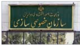
مشاور رئیس سازمان خصوصی سازی: