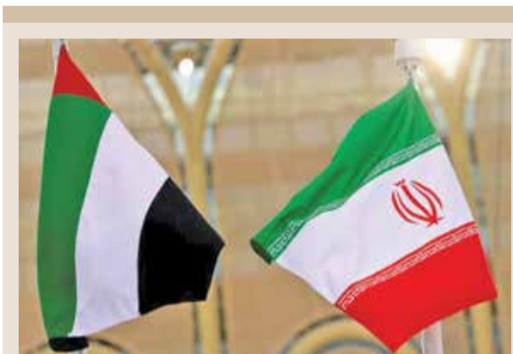
امریکا فراتر رفته است. مقامات ایران گفته اند، آنها اکنون افزایش مبادلات تجاری به ۳۰ میلیارد دلار در ۲ سال آینده را هدف قرار داده اند.

از ایران در رده بندی جهانی قرار گرفته است. سرانه ثروت خانوارها در عربستان نیز ۹۰ هزار دلار محاسبه شده که کمتر از دو برابر این رقم در ایران است. سرانه ثروت خانوارها در بحرین نیز ۸۴ هزار دلار، امارات ۱۵۲ هزار دلار، قطر ۱۶۴ هزار دلار و کویت ۱۷۵ هزار دلار محاسبه شده است. میزان سرانه ثروت خانوارها در برخی کشورهای دیگر که بالاتر از ایران در رده بندی جهانی قرار گرفته اند عبارت است از: لهستان ۵۲ هزار دلار، چین ۷۵ هزار دلار، ژاپن ۲۱۶ هزار دلار، ایتالیا ۲۲۱ هزار دلار و اسپانیا ۲۲۴ هزار دلار.