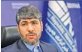
معاون رئیس‌جمهور اعلام کرد