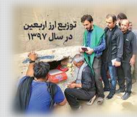
توزیع ارز اربعین در سال ۱۳۹۷