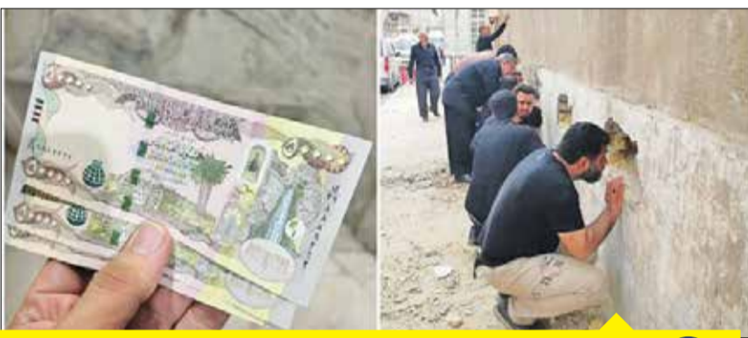
در دولت روحانی و ریاست کلی همتی بر بانک مرکزی، همزمان با مراسم اربعین حسینی، زائران کشورمان برای دریافت دینار عراق سرگردان بودند، صف‌های طولانی در مقابل صرافی‌ها تشکیل می‌شد و در عراق به فاجعه‌آمیزترین شیوه به مردم داد داده می‌شد

«ایران اقتصادی» نحوه توزیع ارز اربعین در دولت‌های روحانی و رئیسی را مقایسه کرد