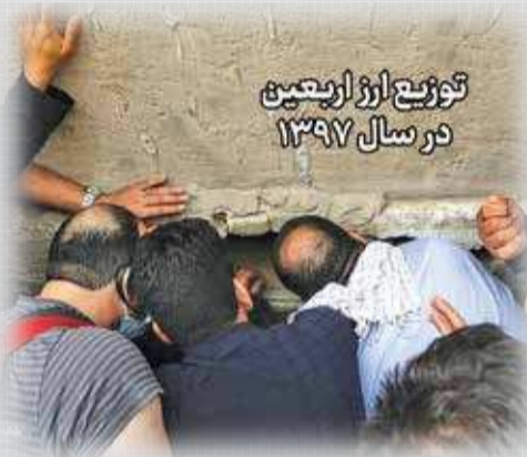
توزیع ارز اربعین در سال ۱۳۹۷