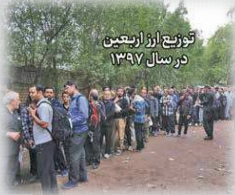
توزیع ارز اربعین در سال ۱۳۹۷