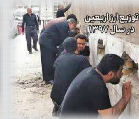
توزیع ارز اربعین در سال ۱۳۹۷