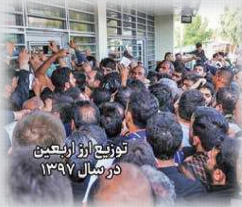
توزیع ارز اربعین در سال ۱۳۹۷

در دولت گذشته همزمان با مراسم اربعین حسینی، زائران کشورمان برای دریافت دینار عراق سرگردان بودند، صف‌های طولی در مقابل صرافی‌ها تشکیل می‌شد و در عراق به فاجعه‌آمیزترین شیوه به مردم ارز داده می‌شد