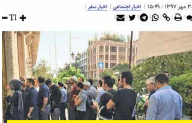
در دولت روحانی و ریاست کلی همتی بر بانک مرکزی، همزمان با مراسم اربعین حسینی، زائران کشورمان برای دریافت دینار عراق سرگردان بودند، صف‌های طولانی در مقابل صرافی‌ها تشکیل می‌شد و در عراق به فاجعه‌آمیزترین شیوه به مردم داد داده می‌شد