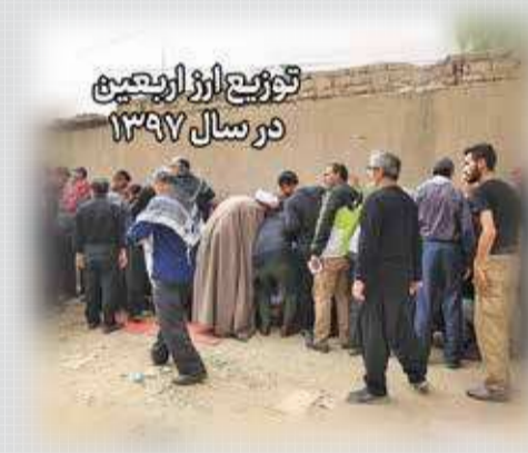
توزیع ارز اربعین در سال ۱۳۹۷

در دولت گذشته همزمان با مراسم اربعین حسینی، زائران کشورمان برای دریافت دینار عراق سرگردان بودند، صف‌های طولی در مقابل صرافی‌ها تشکیل می‌شد و در عراق به فاجعه‌آمیزترین شیوه به مردم ارز داده می‌شد