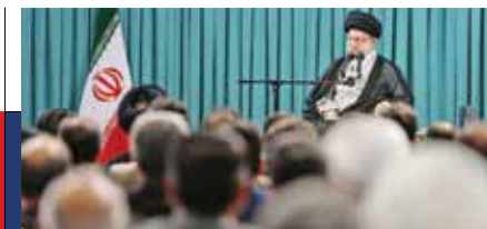
بیانات رهبر معظم انقلاب اسلامی در دیدار اعضای ستاد برگزاری کنگره ملی شهدای استان اردبیل

وحدت و ترویج مذهب اهل بیت دو کار بزرگ اردبیلی‌ها برای ایران