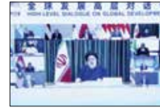
برای حضور در نشست سران «بریکس»