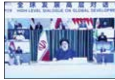
برای حضور در نشست سران «بریکس»