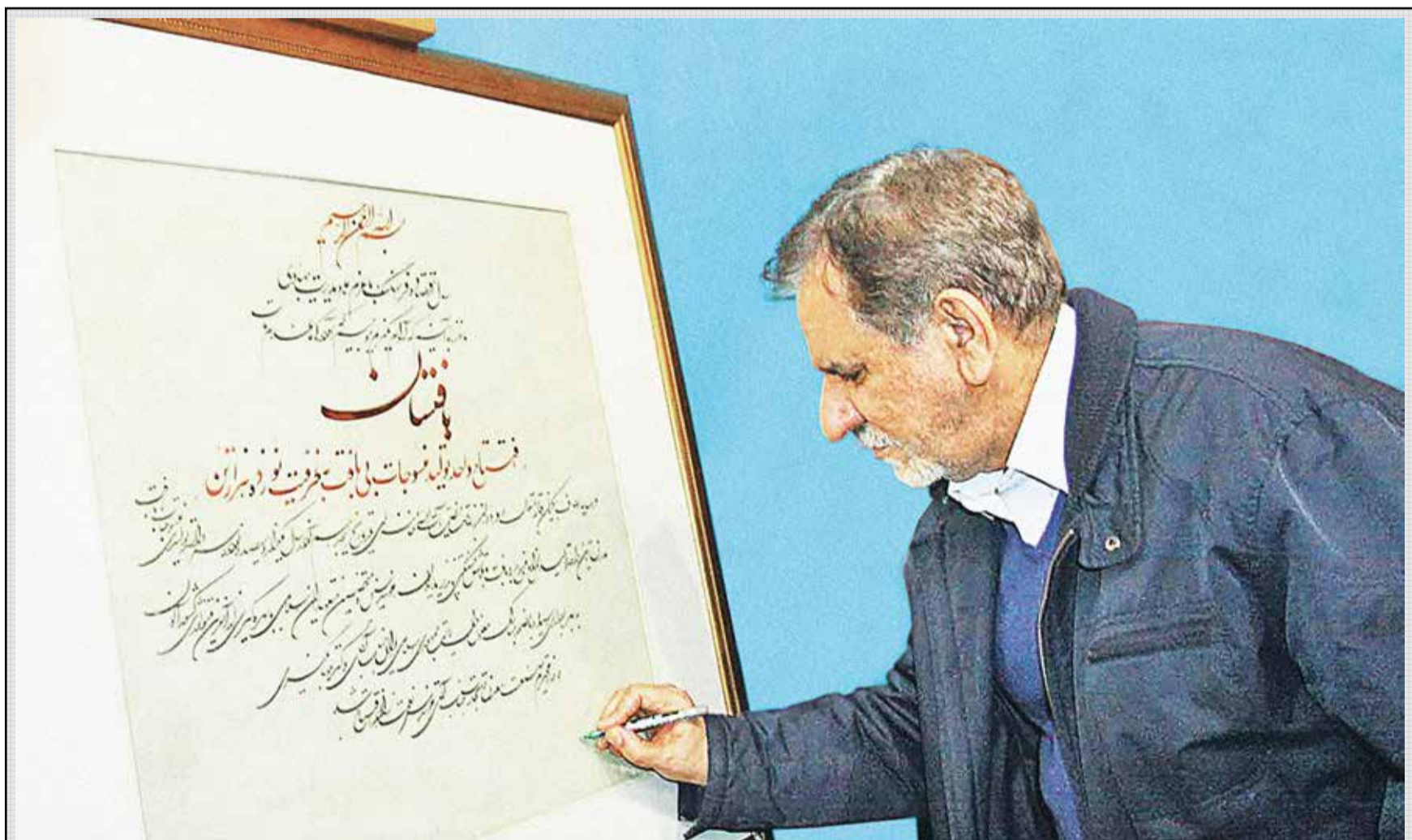
«ایران اقتصادی» از عوامل ایجاد انحصار در بازار پوشک و ماسک توسط دولت گذشته گزارش می‌دهد