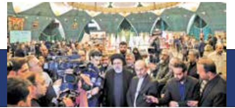
رئیس جمهور در بازدید از صداوسیما به مناسبت روز خبرنگار.