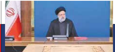
در نود و یکمین جلسه شورای عالی هماهنگی اقتصادی سران قوا صورت گرفت:

بحث و تبادل نظر درباره برخی محورهای اصلاحی سند ساختار بودجه کشور