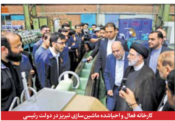
کارخانه فعال و احیاء شده ماشین سازی تبریز در دولت رئیسی

همچنین لازم به ذکر است که علت استفاده مراجع آماری هر کشور از تعاریف بین المللی، قابل مقایسه شدن آمار کشور با دیگر کشورها است.