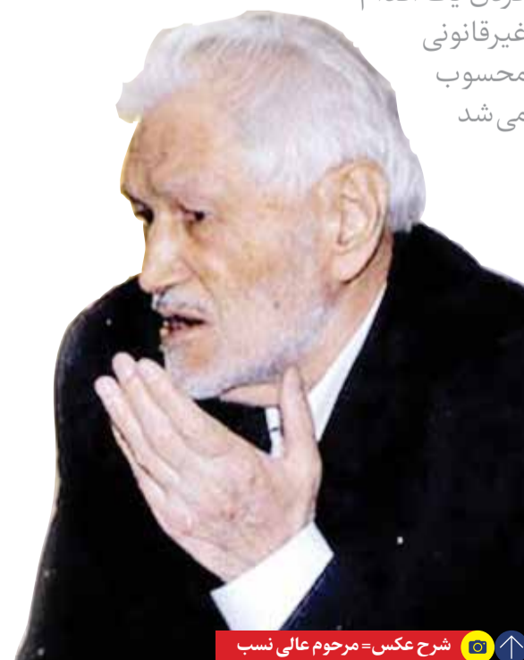
شرح عکس = مرحوم عالی نسب

به بانک‌ها گفت از مشتریان خودتان مابه‌التفاوت بگیرید که این دریافت نه قانونی و نه شرعی بود، ضمن اینکه از منظر حقوقی و حرفه بانکداری و حرفه بازرگانی بین‌المللی عطف به ماسبق کردن یک اقدام غیرقانونی محسوب می‌شد