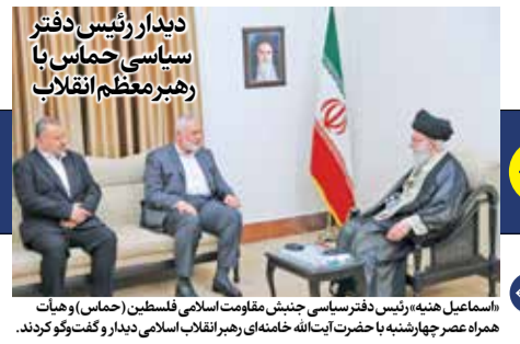
اسماعیل هنیه، رئیس دفتر سیاسی جنبش مقاومت اسلامی فلسطین (حماس) و هیات همراه عصر چهارشنبه با حضرت آیت‌الله خامنه‌ای رهبر انقلاب اسلامی دیدار و گفت‌وگو کردند.

رئیس جمهور از خرج شدن پول ۲۴۰ هزار متقاضی مسکن مهر توسط دولت گذشته بابت هزینه‌های نامعلوم خبر داد