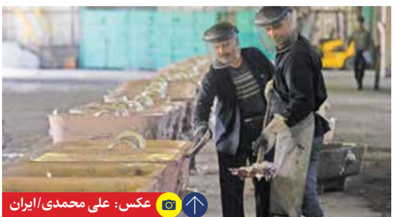
ابلاغ دستورالعمل سازش درون کارگاهی به استان‌هایی که فاقد تشکل کارگری هستند کمک می‌کند تا از این ظرفیت برای رسیدگی به پرونده‌ها بهره‌گیرند.

بدین ترتیب، در راستای اجرای برنامه دولت مردمی سیزدهم برای ایجاد سالیانه یک میلیون شغل توسط استان‌ها و دستگاه‌های اجرایی، سامانه ملی رصد اشتغال با رویکرد ثبت خدمات اشتغال (ثبت و صدور مجوز کسب و کار، تأمین مالی طرح کسب و کار، مشاوره و آموزش مهارت برای نیروی کار و...) طراحی و اجرایی شد، مطابق با آخرین آمار دریافتی از داشبوردهای تمامی این سامانه بیش از یک میلیون نفر به تفکیک استان‌های کشور این خدمات اشتغال را دریافت کردند، در برخی کسب‌وکارها با ثبت خدمت اشتغال تا به ثمر رسیدن و پایداری و ایجاد شغل، نیازمند صرف زمان بود. این آمار مبتنی بر کد ملی و ثبتی مبنا بوده و قابل راستی‌آزمایی بوده است. در سامانه ملی رصد اشتغال کشور حدود ۱۸ هزار کاربری تعریف شده است که خدمات اشتغال ارائه شده ۱۱۶ دستگاه اجرایی را تا سطح شهرستان، به صورت برخط ثبت می‌کنند و رسانه‌ها می‌توانند از اطلاعات و داده‌های خدمات اشتغال ثبت شده این سامانه استفاده کنند. «برنامه نظام پایش اشتغال کشور» مبتنی بر صحت‌سنجی داده‌های ثبتی مبنای سامانه ملی رصد اشتغال و راستی‌آزمایی توزیع منابع اشتغال و اجتناب از انحراف سرمایه‌گذاری طی سه مرحله پیامکی، تلفنی و حضوری از سر بگیرد. در این میان آنچه کارشناسان اقتصادی را به بازار کار کشور امیدوار کرده است، بهبود مشارکت اقتصادی بوده است، به‌طوری که نرخ مشارکت اقتصادی به بیش از ۴۰ درصد افزایش یافت و این نرخ به ۴۰,۹ درصد در سال ۱۴۰۱ رسید. آنچه داده‌ها نشان می‌دهند در سال ۱۴۰۱، یک میلیون شغل در کشور ایجاد شد.