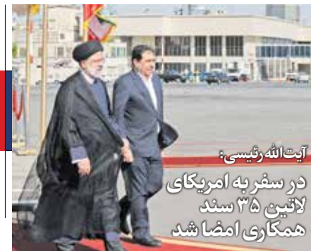
آیت الله رئیسی:

در سفر به امریکای لاتین ۳۵ سید همکاری امضا شد