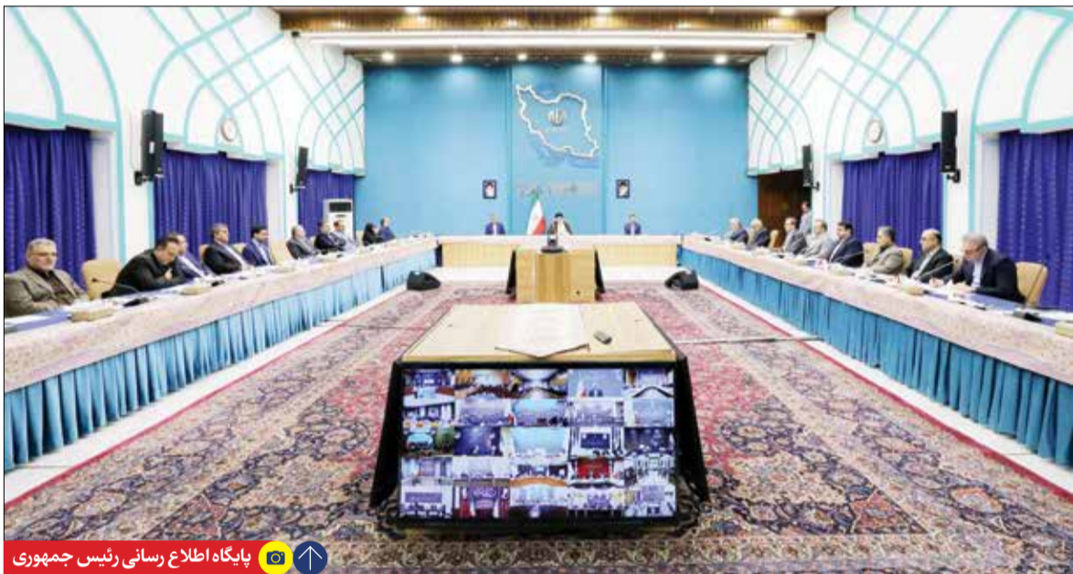
پایگاه اطلاع رسانی رئیس جمهوری

کرده و با ارائه مشوق‌های لازم و همچنین بهره‌گیری از سازکارهای قانونی که در شورای عالی شهرسازی به تصویب رسیده است، این زمین‌ها را به ظرفیت ساخت و سازهای مسکن کشور اضافه کنند.