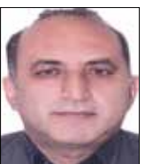
واحد مرغ مادر