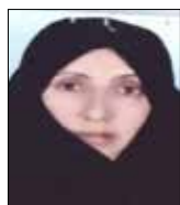
کشور سعادت‌فر مدیرعامل صندوق اعتبارات خرد زنان روستایی