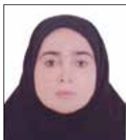
■ صغری چترزری مرکز جمع‌آوری شیر