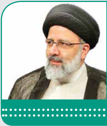
مایید برویم به طرف استقلال کشورزی. رئیس جمهور