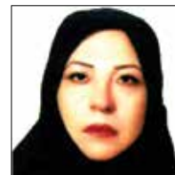
گلک خانم باغن زن کارآفرین