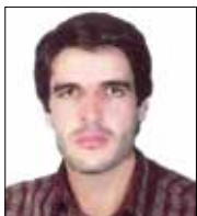
رضایلفی پرورش دهنده گوسفند